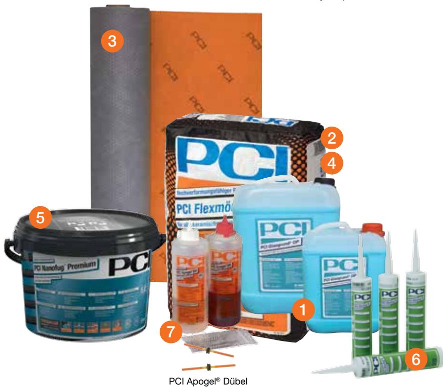
PCI Apogel® Dübel

7 Silikátová živica PCI Apogel® SH na vyplňovanie trhlín v podklade Klzný trň PCI Apogel® Dübel na pohyblivé spojenie dilatovaných podkladov