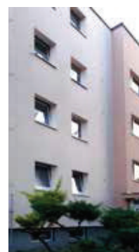
Pred a po čistení sanačným biocídnym prípravkom PCI Multitop® FC